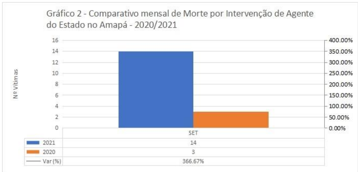
Gráfico 2 –