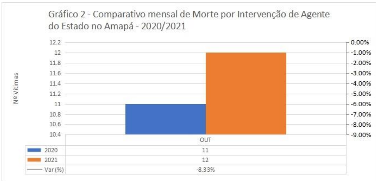
Gráfico 2 –