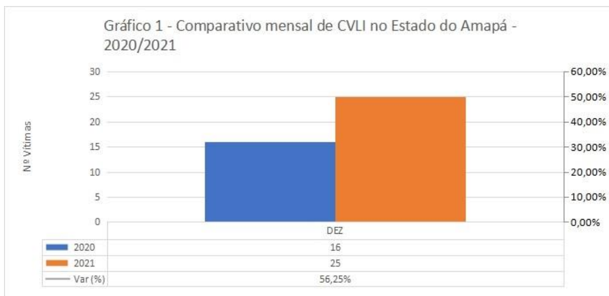
Gráfico 1 –