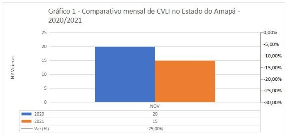
Gráfico 1 –