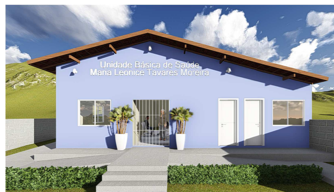
IMAGEM 01 - FACHADA