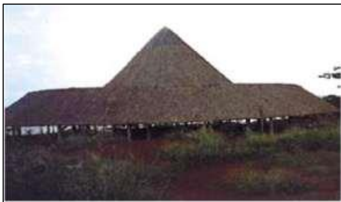
Figura 1 – Edificação de madeira com cobertura de fibras vegetais.

devendo este emitir laudo técnico com parecer conclusivo e anotá-lo no seu órgão de classe.