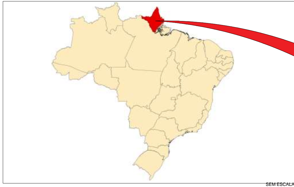
MAPA DO BRASIL-ESTADO DO AMAPÁ