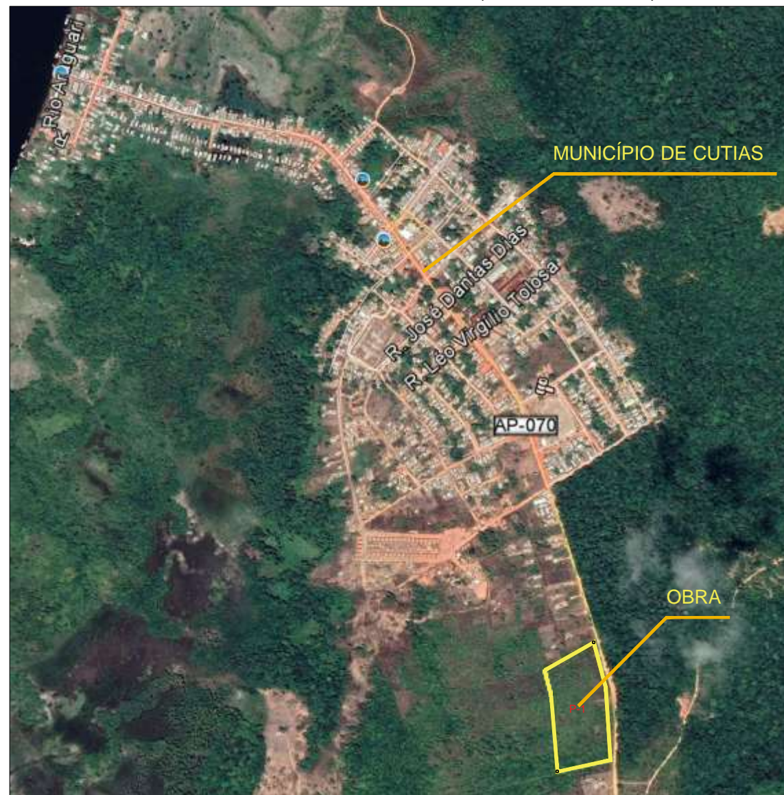
MUNICÍPIO DE CUTIAS/AP-(ÁREA URBANA)